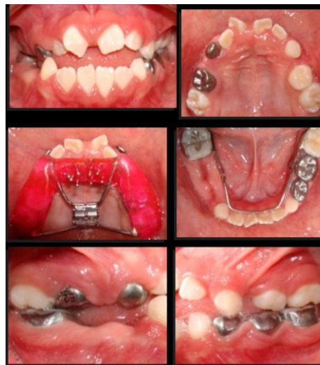
Figura 5. Fotografías intraorales después del tratamiento dental y con aparatología ortopédica.

La fase número tres se manejó con ortopedia maxilar, se colocó un aparato miofuncional (Morales I) con trampa lingual, buscando realizar protracción maxilar, conformación del arco, desaparecer el hábito y contener el crecimiento vertical de la mandíbula. 16, 17