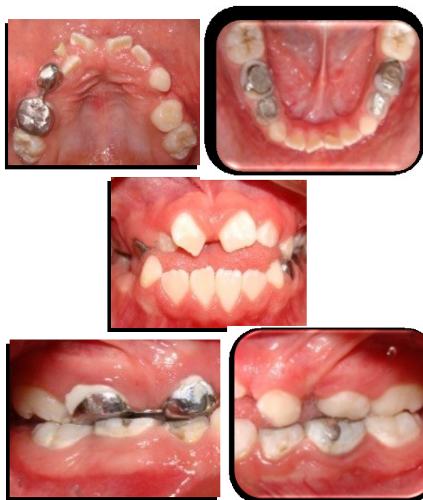
Figura 4. Fotografías intraorales

El análisis radiográfico (Figura 1) mostró múltiples obturaciones con un inadecuado sellado, además de tratamientos mal realizados que provocaron la pérdida de soporte óseo a nivel del órgano dental (o.d.) 84 y 85 y perforación en furca del segundo molar temporal inferior del lado derecho, además de un mantenedor de espacio (Figura 2) elaborado de forma inadecuada y provocando problemas periodontales.