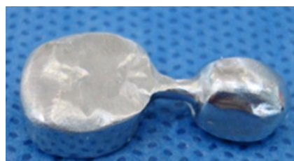
Figura 2. Mantenedor de espacio colado

Se tomaron fotografías extraorales: frontal, de sonrisa y lateral derecha (Figura 3). También se tomaron fotografías intraorales: frontal, oclusal superior e inferior y laterales derecha e izquierda (Figura 4), en las fotografías intraorales se observa que las obturaciones de los o.d. 74, 75, 84 y 85 presentan obturaciones con amalgama desajustadas y con filtración. 9