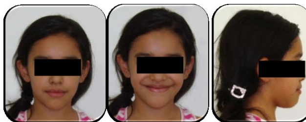
Figura 3. Fotografías extraorales