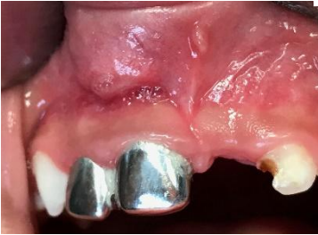
Figura 1. Fotografía intraoral en la cual se observo edema y hematoma en el tejido blando.