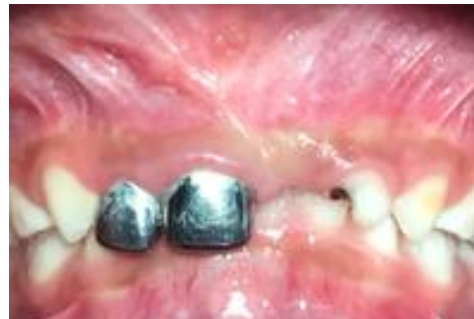
Figura 7. Fotografía intraoral dos semanas después de la cirugía.

A la exploración bucal se observó edema en la zona vestibular de los incisivos superiores, los órganos dentales (O.D) 51 y 52 estaban restaurados con coronas de acero cromo, las cuales fueron colocadas 1 meses antes con odontólogo particular. A la palpación se encontró tejido fibroso, ligero dolor a la palpación y hematoma en la zona (Figura 1). ¿La radiografía periapical de los (O.D) 51 y 52, muestra la presencia de un