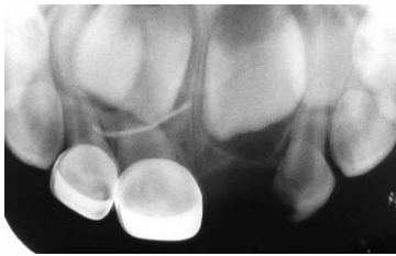
Figura 2. Radiografía periapical que muestra la presencia de cuerpo extraño.