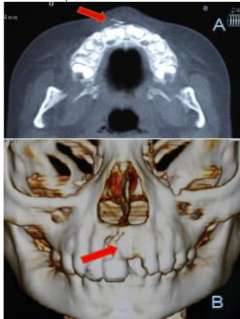
Figura 3. Corte transversal. A) Evidencia de cuerpo extraño semejante a una aguja en la premaxila. B) Reconstrucción 3D.