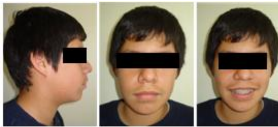
Figura 9. Fotografías extraorales.