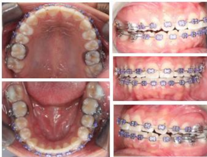
Figura 8. Colocación aparatología fija inferior.