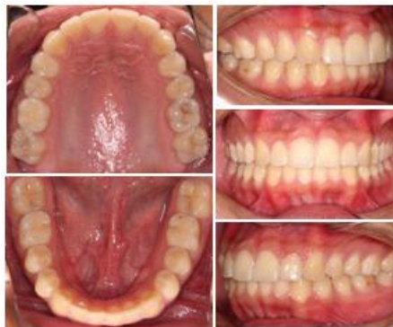
Figura 12. Fotografías intraorales finales.