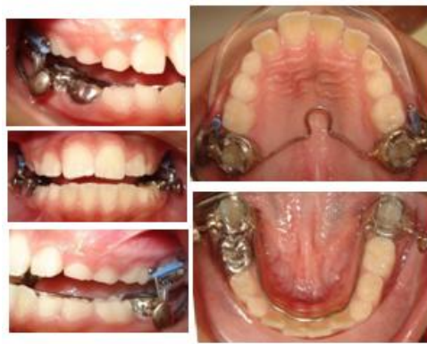
Figura 6. Cementación del aparato.