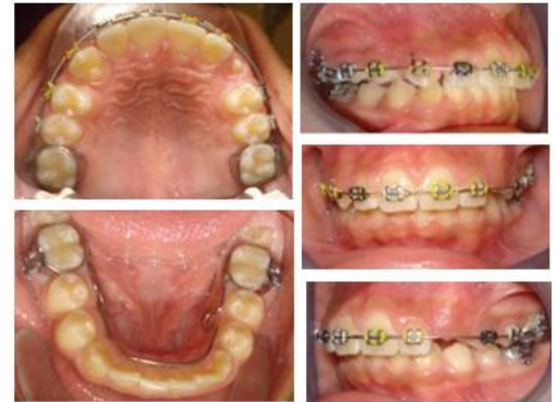
Figura 7. Colocación de aparatología fija.