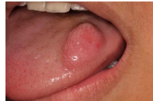
Figuras 2 y 3. Fotografía de biopsia excisional con cortes.