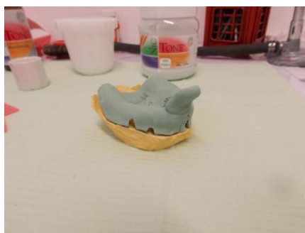
Figura 2. Cucharilla individual de acrílico.