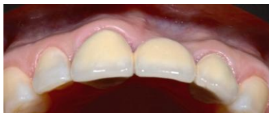
Figura 1. Vista oclusal del defecto clase III de Seibert.