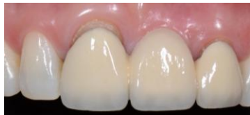
Figura 2. Vista Frontal de la prótesis desajustada de 11 a 22 con presencia de recesión Miller I.