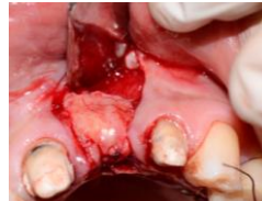
Figura 8. Estabilización del injerto en el lecho receptor.