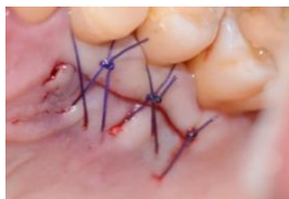
Figura 6. Sutura del paladar.