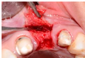
Figura 3. Preparación de lecho quirúrgico.