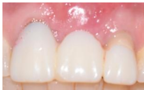
Figura 12. Dos semanas de cicatrización.