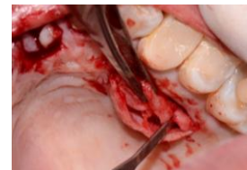
Figura 4. Incisión lineal y obtención del injerto de tejido conectivo.