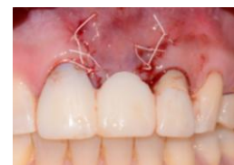
Figura 9. Posicionamiento del provisional libre de presión sobre el injerto.