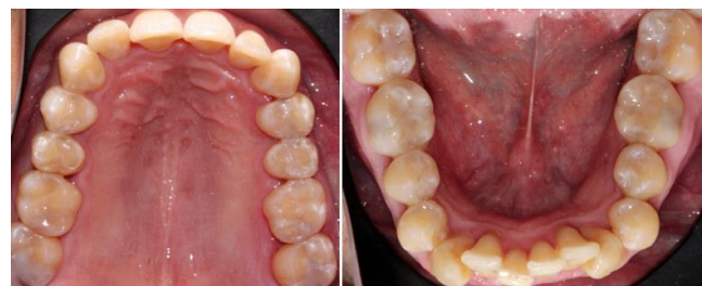
Figura 7. Fotografías intraorales en fase 3 de mantenimiento periodontal donde se observa un resultado exitoso.

Crear estrategias para motivar al paciente y mejorar la comunicación es esencial para lograr los objetivos de un tratamiento exitoso a largo plazo; tales como