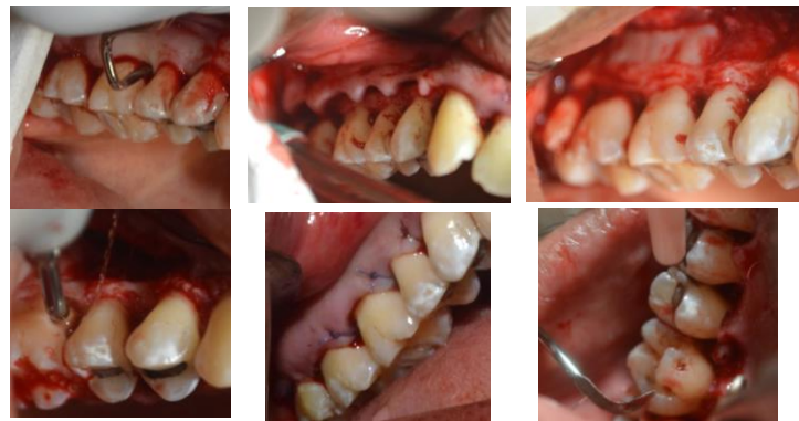
Figura 6. Fase 2 quirúrgica, desbridamiento del 1 y 2 cuadrante para eliminar bolsas activas persistentes.

al paciente con otros especialistas médicos para tratar el estado sistémico, terapia psicológica para trabajar en la autoestima y comunicación del paciente. El tratamiento integral de las diferentes especialidades con los familiares del paciente; predeterminantes del éxito del tratamiento. El uso de cepillo eléctrico y auxiliares de higiene oral son más viables que el cepillado manual en el control de placa. Se encuentran índices de placa dentobacteriana más altos y a la vez de problemas periodontales y caries en personas con disfunción familiar moderada y niveles más bajos en familias con disfunción de tipo leve. Es esencial involucrar a la familia en el tratamiento y lograr vínculos positivos hacia el paciente. 9,10,12-15