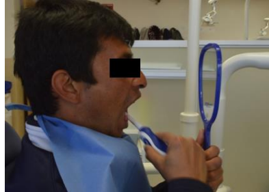
Figura 3. Control personal de placa, refuerzo de técnica de cepillado y motivación.