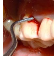
Figura 4. Raspado y alisado radicular subgingival mediante curetas Gracey.