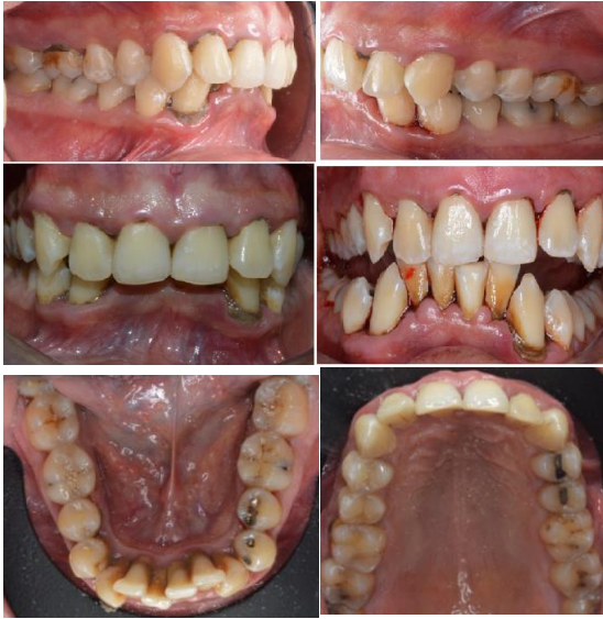
Figura 1. Fotografía intraorales donde se observa presencia de cálculo en zona anteroinferior y sobremordida.