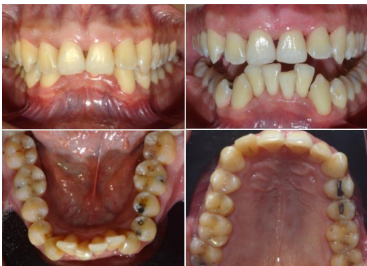
Figura 5. Fotografías intraorales posteriores a la fase 1.