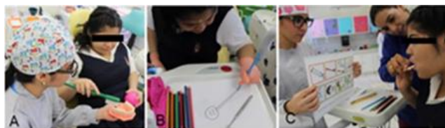
Figura 3. Desensibilización. A) La paciente explora con el espejo bucal, B) Se muestra y explica el uso de los retractores, C) Control de higiene.