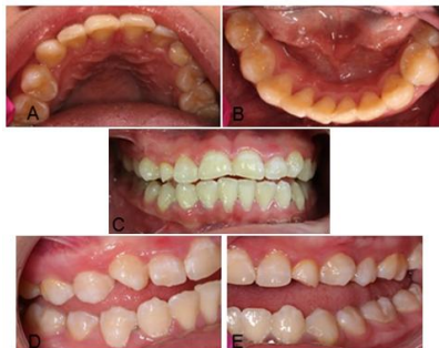
Figura 1. Fotografías intraorales, A) Arcada superior, B) Arcada inferior, C) Arcada oclusal, D) Lateral derecha, E) Lateral Izquierda.

para realizar modificaciones en el régimen alimenticio, logrando una mejoría para estimular a la paciente a tener una dieta más saludable.