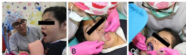
Figura 4. Tratamiento restaurativo. A) Colocación de grapa dental, dique de hule y abreboca, B) Se observa paciente cómoda y relajada durante la consulta dental, C) Se realiza operatoria dental.