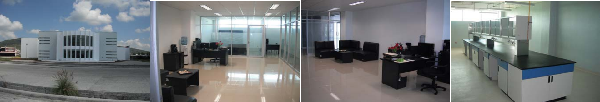
FOTOS DE OBRA

NOTA: LA ETAPA ESTA TERMINADA, FALTA POR CUBRIR EL FINIQUITO DE LA OBRA. ALGUNAS AREAS DEL EDIFICIO INCLUSIVE YA ESTAN EN USO.