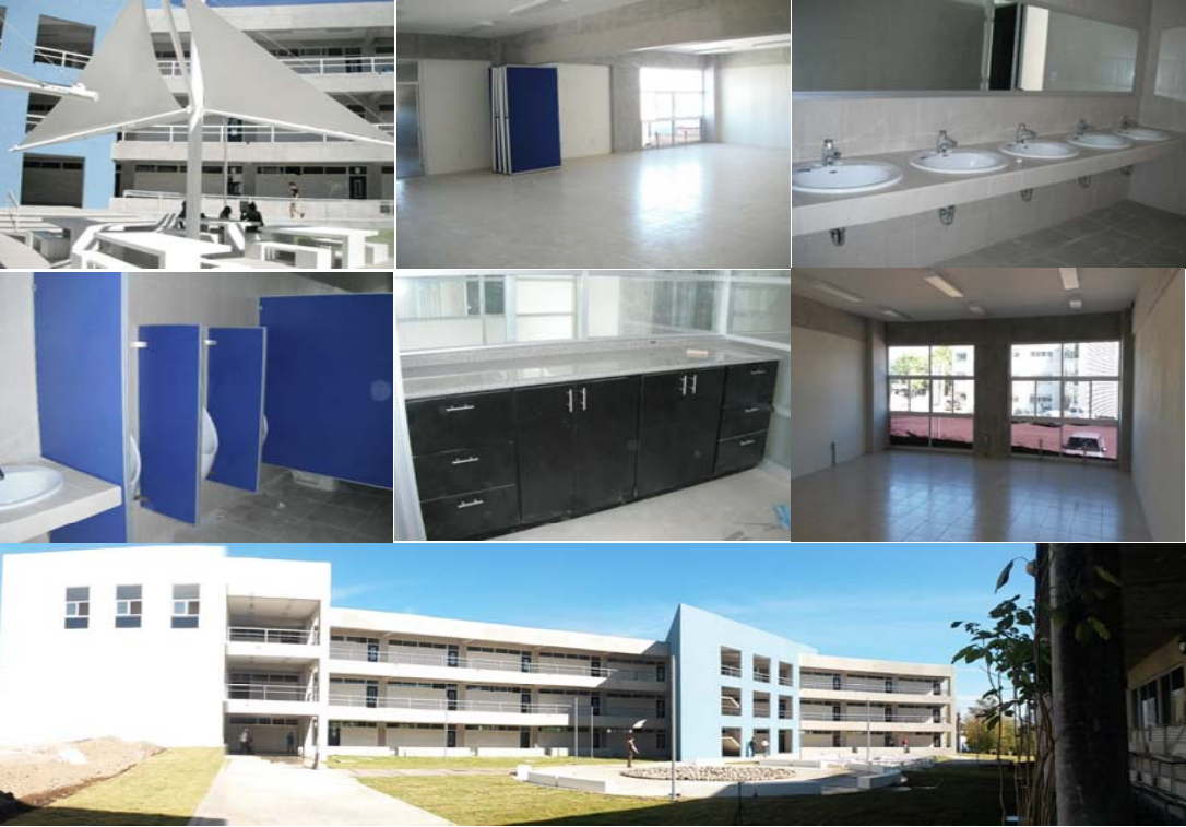
FOTOS DE OBRA CUCSH