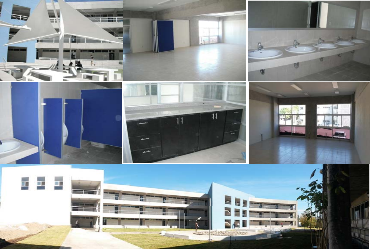
FOTOS DE OBRA CUCSH