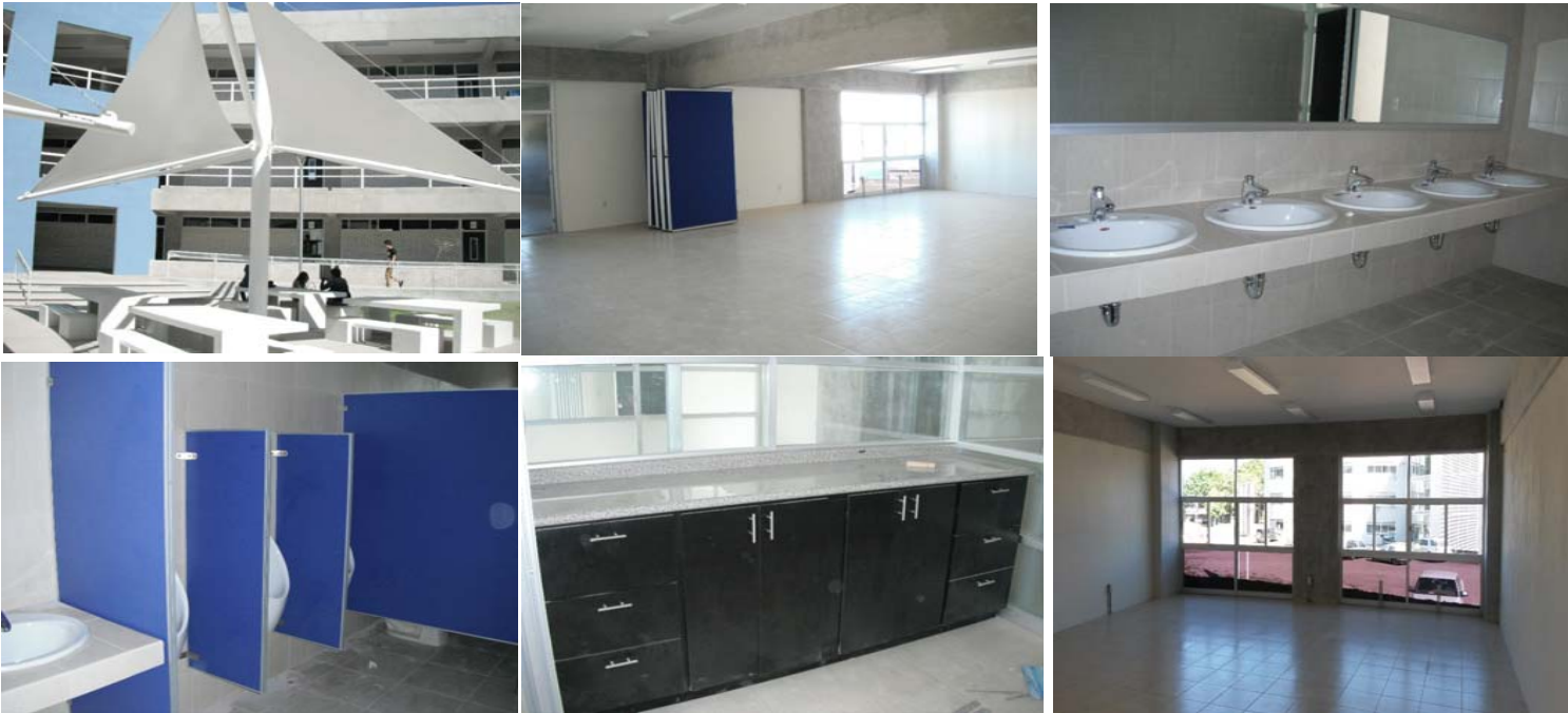
FOTOS DE OBRA CUCSH